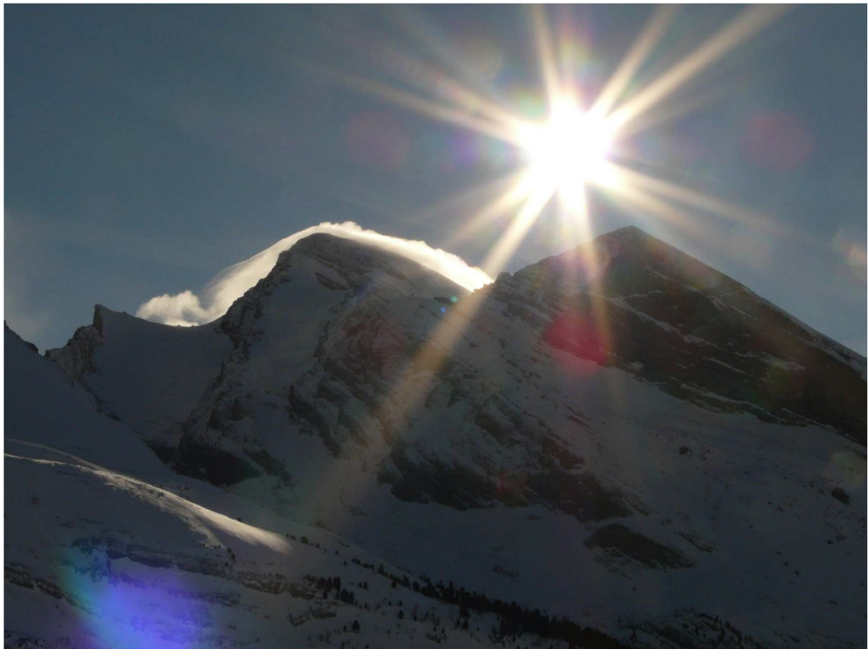
Sunnbüel/Kandersteg mit Rinderhorn (3448 müM)